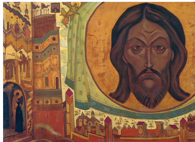
Y Nosotros Vemos por Nicolás Roerich, 1922

“‘He intentado revivir la ley de Moisés, en los corazones de la gente. Y les digo que ustedes no entienden el verdadero significado de la ley porque ésta no enseña la venganza sino el perdón. Pero el significado de estas leyes ha sido distorsionado.’