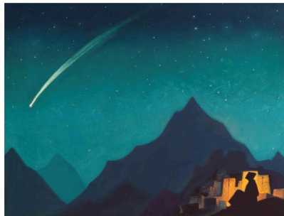
La Estrella del Héroe por Nicolás Roerich, 1936

profetizaron los sabios que en nuestros días la humanidad se volvería ciega por la electricidad y sorda por el teléfono? Hace poco tiempo, se consideraban los motores como una invención impráctica. Incluso, se predijo el fracaso del telégrafo inalámbrico así como el de la aviación. Y ahora, cuando tantas conquistas extraordinarias le han sido otorgadas a la humanidad, cuán rápidamente las personas han logrado hacer una abominable estandarización aún de la aplicación de la energía y de los elementos, aniquilando así el posible realce de estas conquistas. Intentemos hacer girar el regulador de un radio ordinario para ver lo que hay en el aire, y el infinito responderá con un pandemonio, y el desate de la locura. De la misma manera, todas las maldiciones del odio y la envidia están suspendidas en el espacio y están destruyendo el prana sanador.