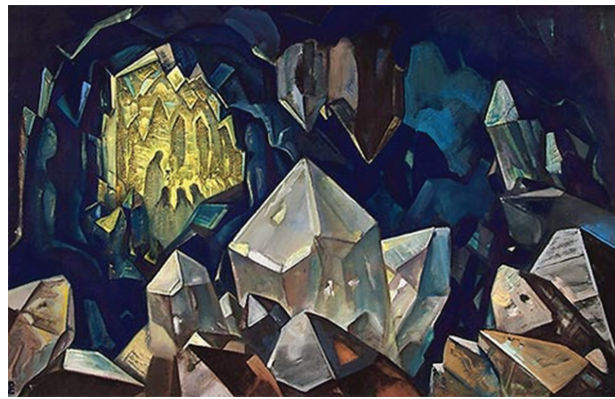
Lo Más Sagrado por Nicolás Roerich, 1933

su poder ya que sin duda, en una vida tan breve, no pudieron haber acumulado una calidad de voz y un conocimiento de las leyes de las armonías? ¿Son estos milagros? No, porque todas las cosas suceden como resultado de las leyes naturales. Muchos miles de años atrás estas personas ya habían moldeado sus armonías y sus cualidades. Y vienen otra vez para aprender aún más de diversas manifestaciones.” (94)