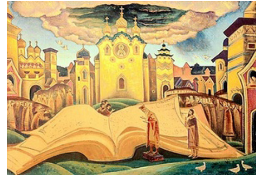
The Book of Doves by Nicholas Roerich

Carta de La Red de Colaboradores continúa de la pág 2